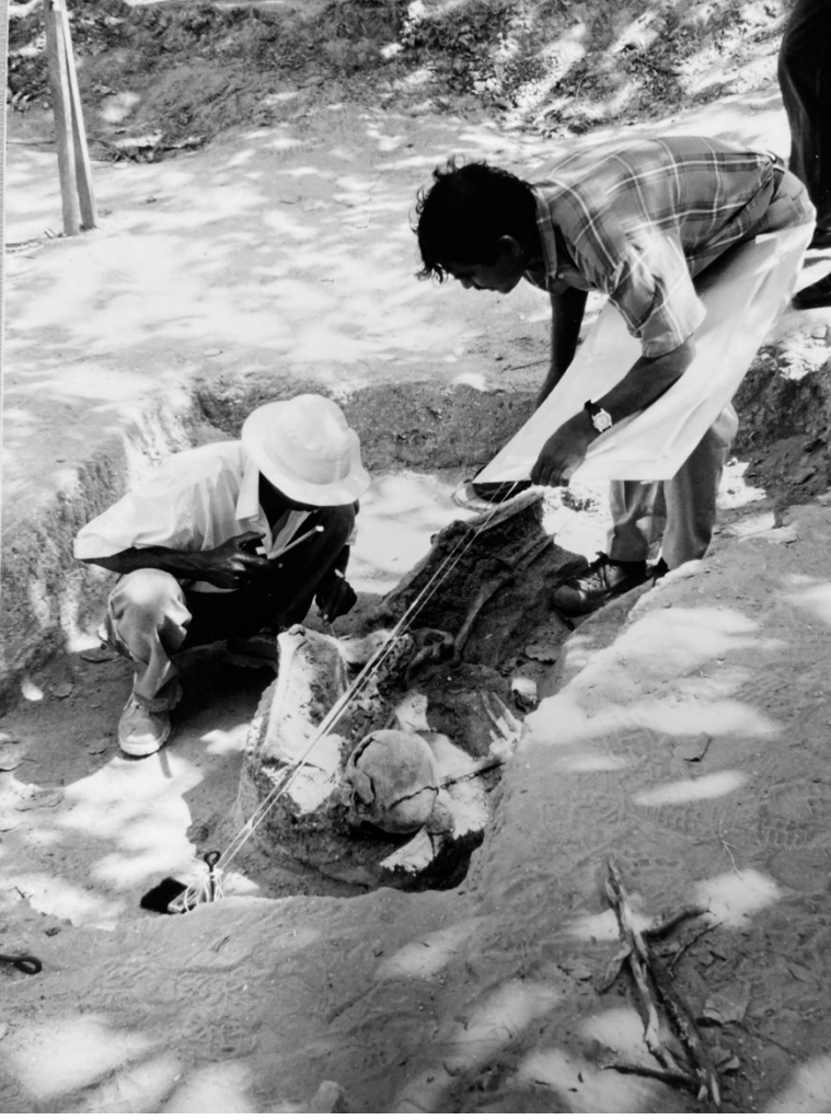
1999இல் செம்மணியில் நடந்த அகழ்வுப் பணியின்போது பேராசிரியர் நிரியல் சந்திரசிறி உள்ளிட்ட தடயவியல் நிபுணர்கள்.