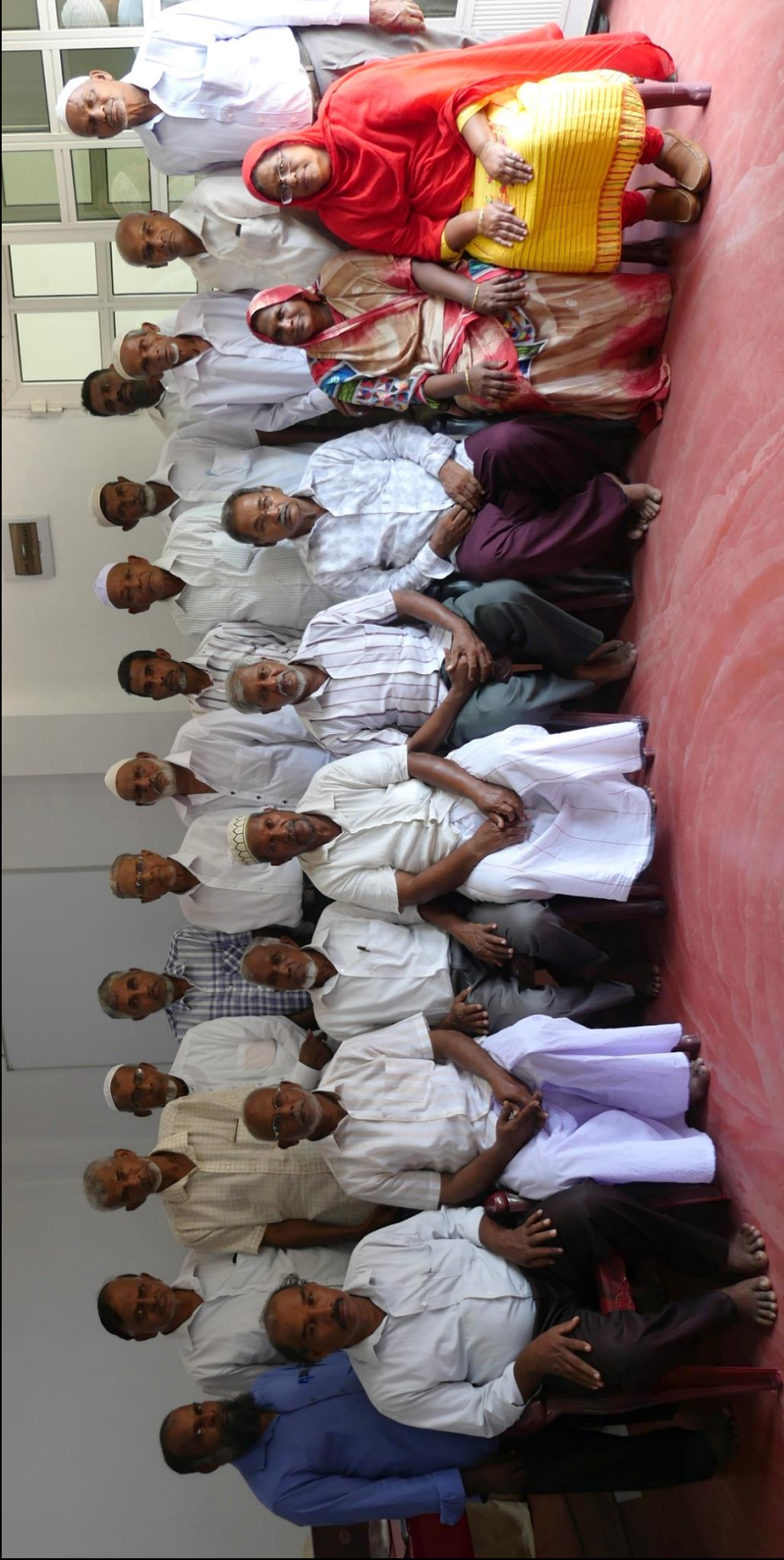
Committee Members Group Photo - Ampara District Alliance for Land Rights (ADALR)