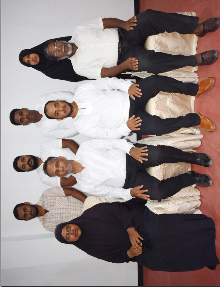
Staff Group Photo - Human Elevation Organization